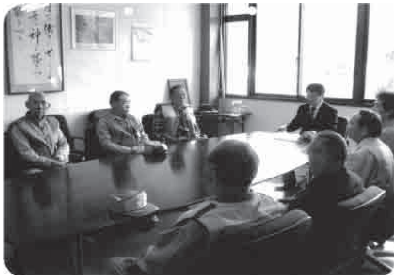
鳥獣害被害見回り駆除隊