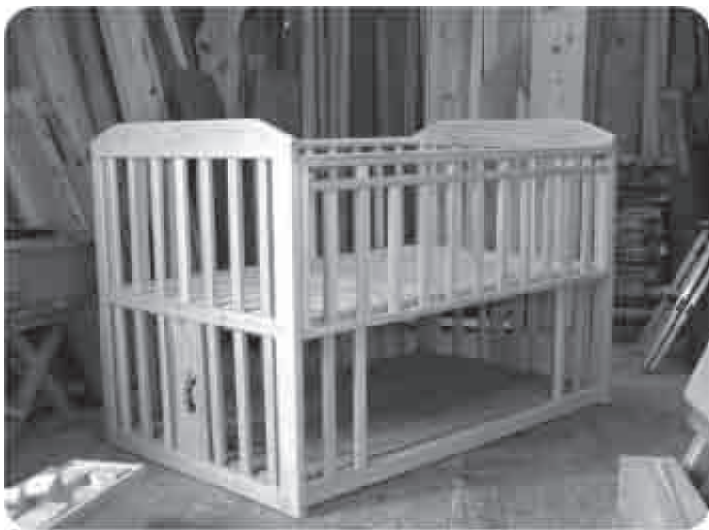
古座川産材を使用したベビーベッド

斎場周辺管理委託料は、火葬業務、火葬場の中の清掃や敷地内の草刈等を委託するものである。