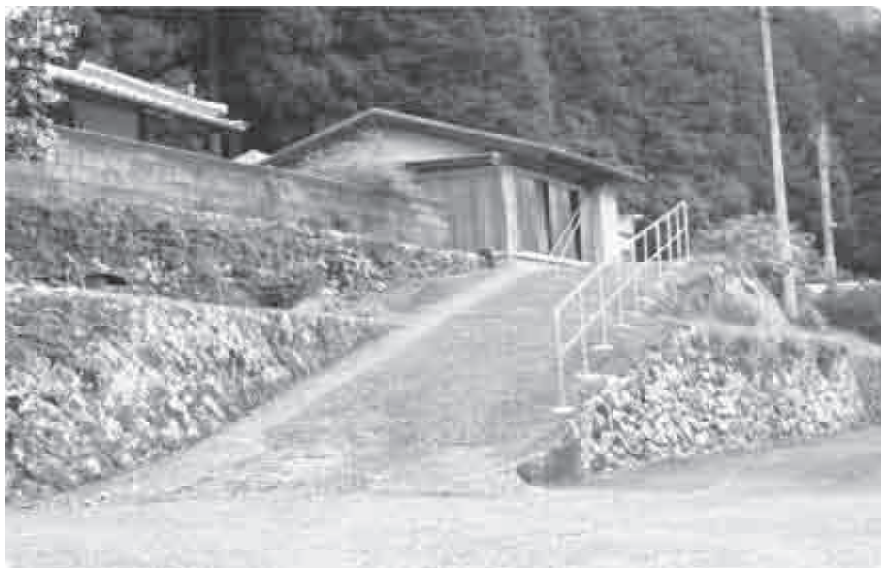
介護保険の住宅改修（手摺設置：小川）

木造住宅耐震改修サポート事業では、県と町で最大60万円、国の助成として工事費の11・5%を加算した補助が受けられる。バリアフリー化について