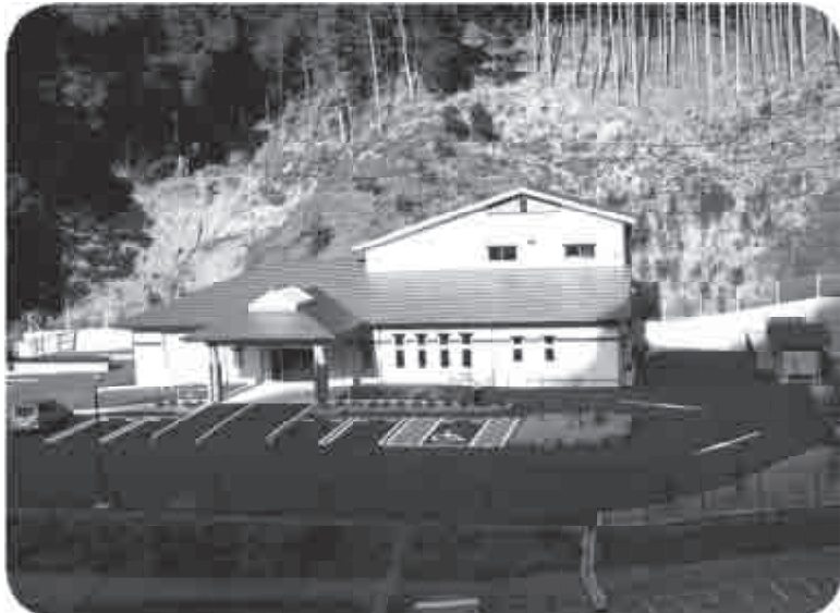
古座川町斎場（鶴川）