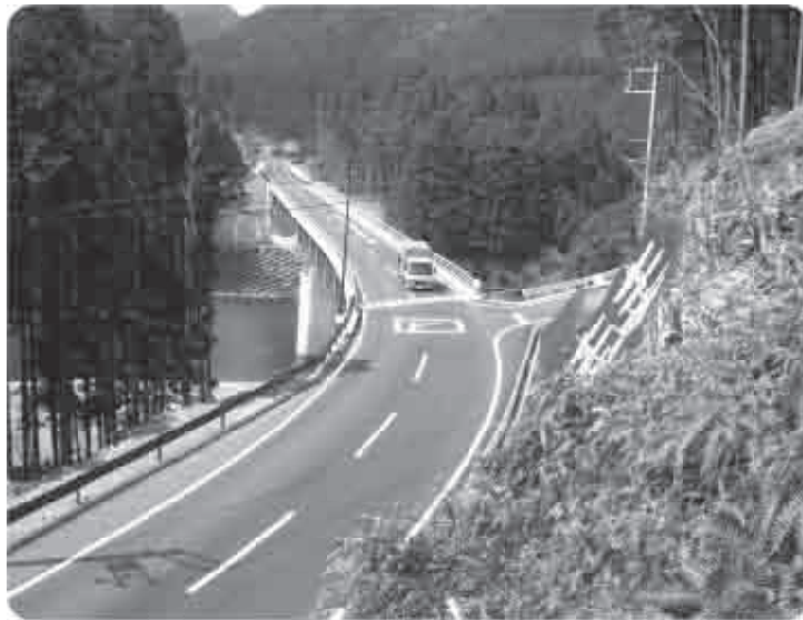
深ノ平橋付近（蔵土）