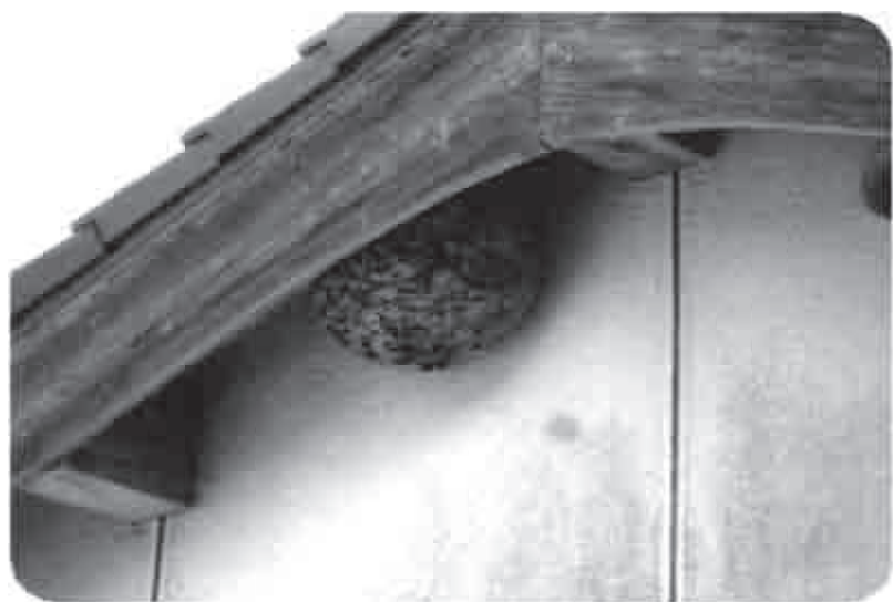
補助の対象となるすずめ蜂の巣