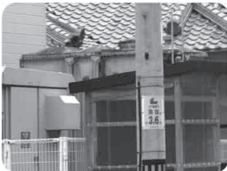
津波に備えて海拔表示 (高池)

制を調べていただきたい。 町長 毎年採用試験をして面接するたびに、古座川町に合格すれば町内へ住んでいたいただきたいとお願いしているが、町外出身の殆どが町内へ住んでくれない。それが私としても非常に心苦しいところである。 併設については検討課題としたい。 (この文章は本人がまとめたものです)