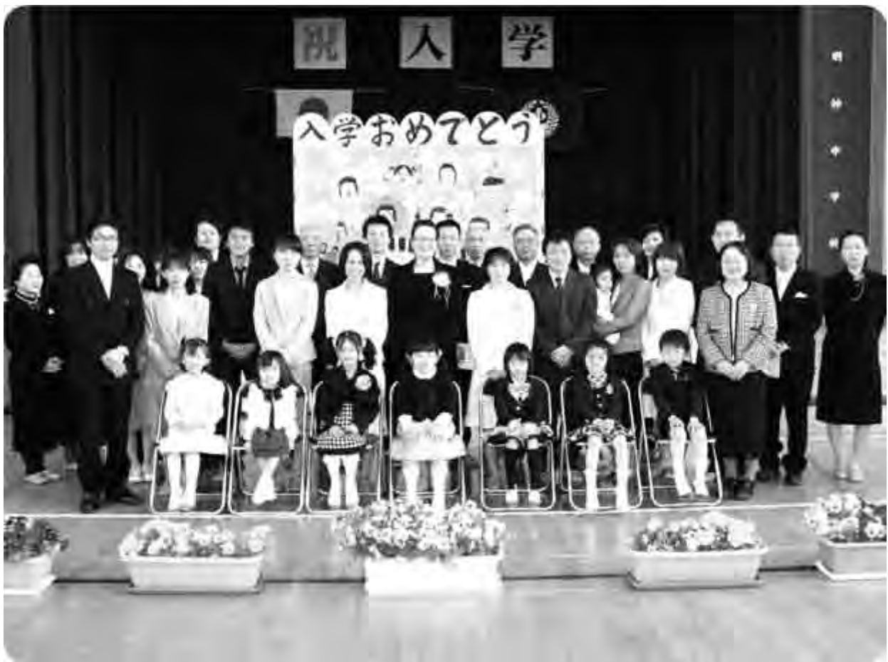
明神小学校入学式

古座川町議会 TEL 0735-72-3410 FAX 0735-72-1858