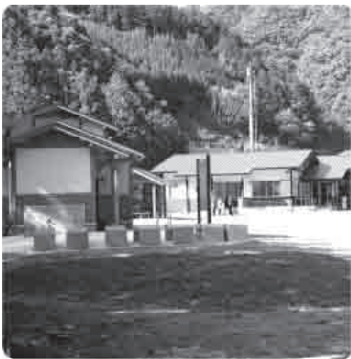
滝の拝物産販売所予定地

地域力の低下は大きな問題なので、最近出てきた「古座川WAKASU」といった若者や、ぼたん荘・観光協会等と連携しながら地域全体で支えていこうという予算編成をした。