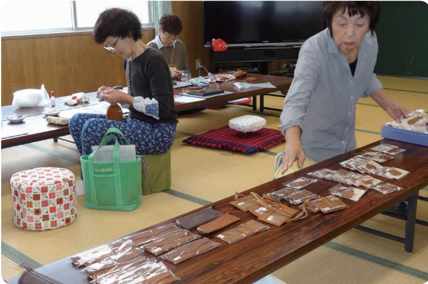
手作りで縫製された猪皮レザークラフト