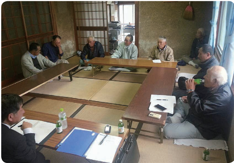
地区懇談会（平井地区）

古座川町議会では、昨年3月から議会改革特別委員会を立ち上げて、議会の改善や活性化などを協議しています。その中で、地区懇談会を開いて直接住民の声を聞くことも重要だとの見解もあり、まず七川地区で懇談会を開催することにいたしました。11月26日に、議員