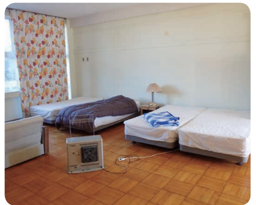
教室を改造した宿泊施設