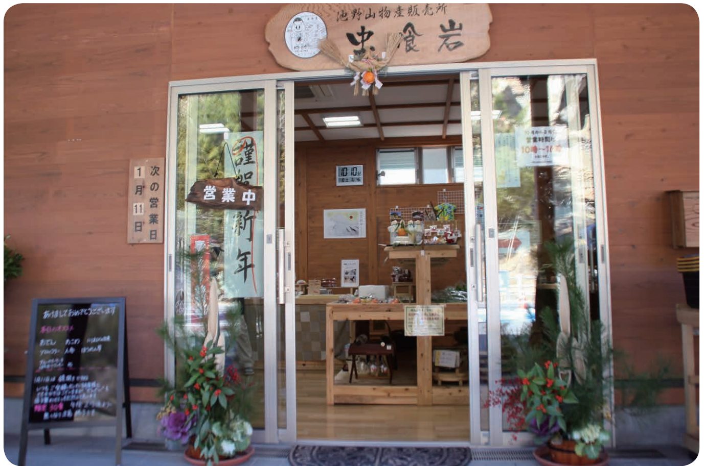
門 松（池野山道の駅 虫喰岩）