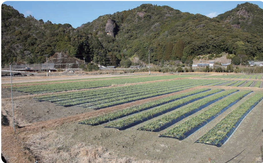
にんにくの作付け（大柳）