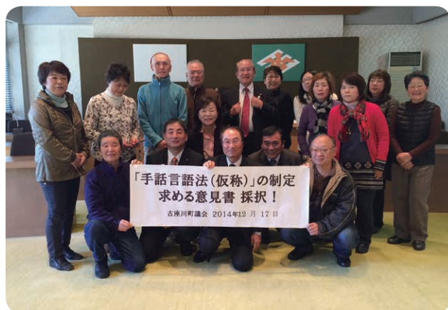
和歌山県聴覚障害者協会の皆さんと総務常任委員