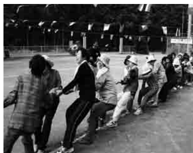
男女対抗綱引きの様子