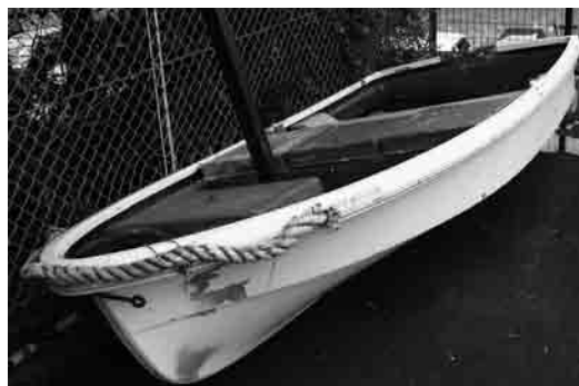
保管している小型ボート