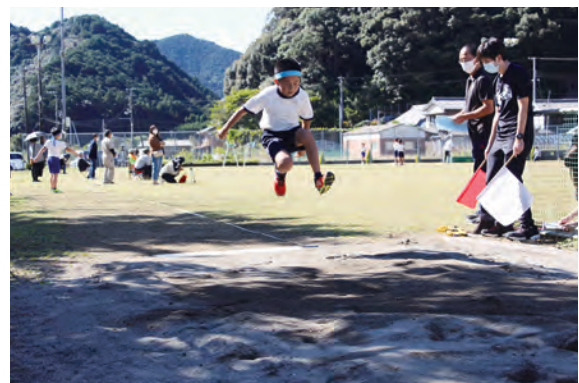
走り幅跳びの様子