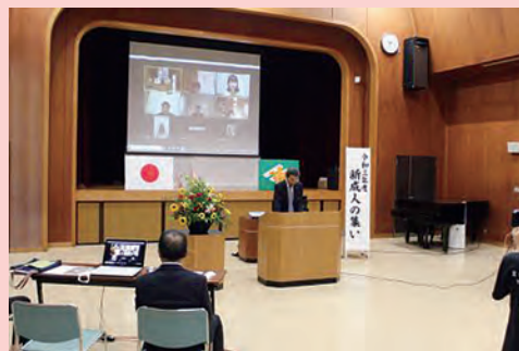
オンライン新成人の集い（中央公民館）