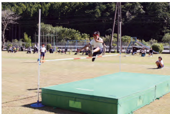
走り高跳びの様子