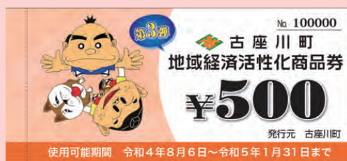
第3弾地域振興券 使用可能期間 令和4年8月6日～令和5年1月31日まで