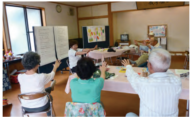
巡回型「ふれ愛カフェ・よりみち」の様子