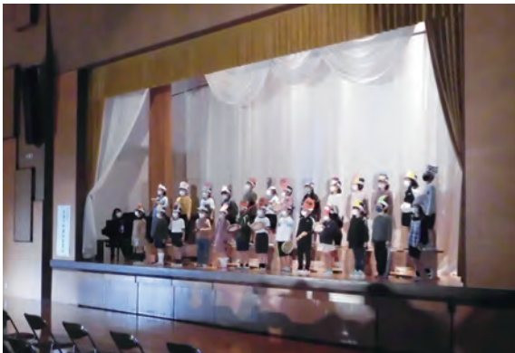
連合音楽会の様子