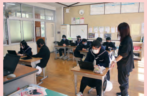
PC端末を使用した授業（明神中学校）