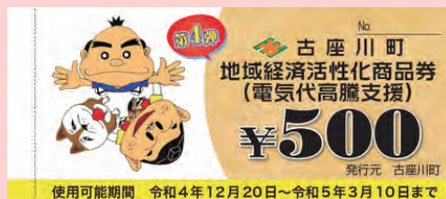
第4弾地域振興券 使用可能期間 令和4年12月20日～令和5年3月10日まで