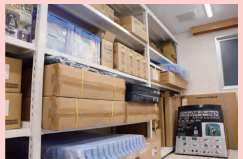
感染症対策物品の備蓄（津波避難総合センター）