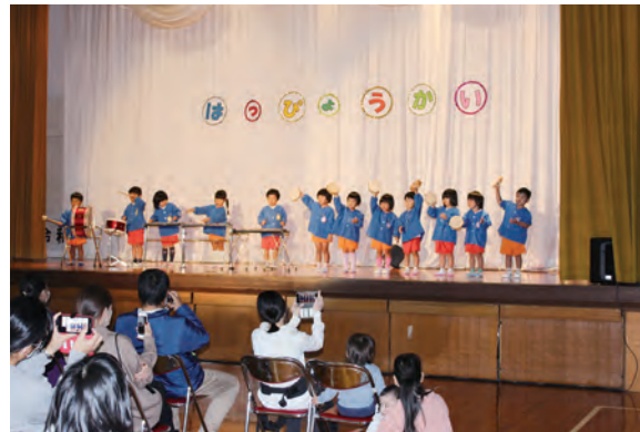
合奏の様子（高池保育所）